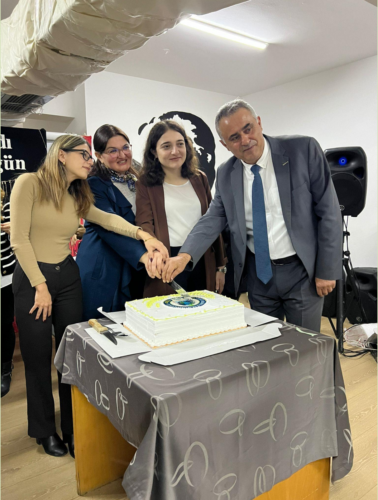
Şehit Jandarma Er Halim Çimen İlkokulu BRİFİNG DOSYASI 2024/2025